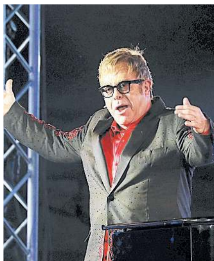
Su Radiodue Rai Elton John a Pompei

Ma sono racconto vivo e non rovina le vestigia di Pompei proprio come le avventure del «Rocketman», la melodia strappacuore di «Your song», il manifesto di «Goodbye yellow brick road», gli inni generazionali capaci di conquista-